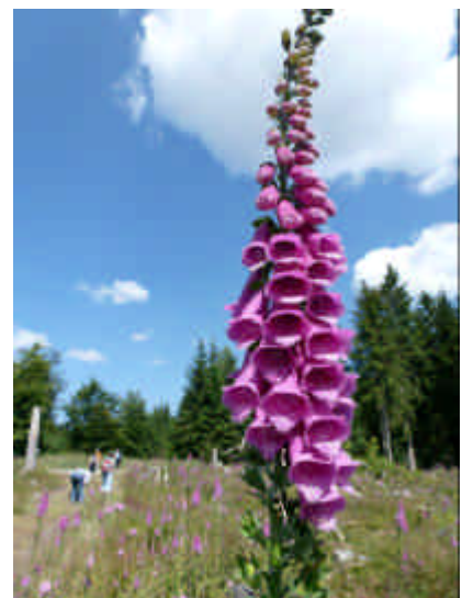
Der SAV Wanderweg führte durch ein Meer von Digitalis. Der Rote Fingerhut, eine alte Arzneipflanze, zeigte sich in großer Anzahl und mit besonders ansprechenden Exemplaren, darunter auch weiße.