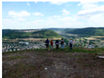
Am Oberen Rodstein sieht man Oberkochen aus der Vogelperspektive und der Blick reicht weit über das Kochertal nach Norden.

reicht werden kann, schloss die Wanderwoche bei einer Einkehr in Nietheim.