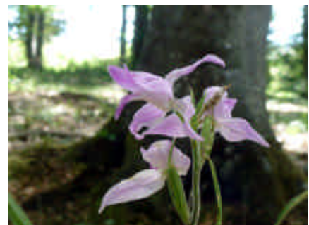
Seltenes am Wanderpfad: Das Rote Waldvögelein

Auch am vierten Tag blieben die Wanderer, von der Kapfenburg ausgehend, auf dem HW1. Ein beeindruckender Ausblick in das Ellwanger Bergland waren die ersten Eindrücke an diesem Tag. Über eine Brücke über die Autobahn A7 gelangte man zum Wöllerstein, 723 Meter über NN, einem liebevoll hergerichteten Ort der Ruhe, mit Schutzhütte, Gipfelkreuz und aufs Feinste hergerichteten Gipf-