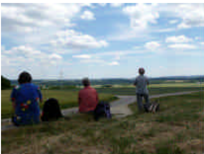
Bei der Rast am Wasserturm bei Hohenberg/Ebnat zeigt sich das Härtsfeld in seiner ganzen Weite.

laubt. Der weitere Weg führte über Ochsenberg, entlang der Landkreisgrenze bis zum sogenannten Egelsee, der trotz seiner Höhenlage im Wald, nach Auskunft eines pensionierten Försters, noch nie ausgetrocknet war. Über gut ausgebaute Waldwege, über die auch die Waldköhlerei Wengert