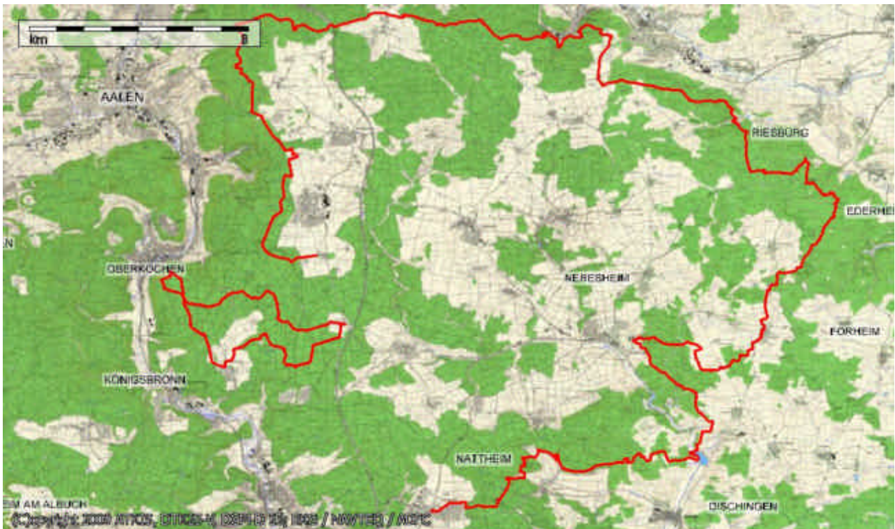
Die Wanderroute bei der Wanderwoche Härtsfeld 2014: von Nattheim ausgehend erreichte man am vierten Tag Niesitz. Der fünfte Tag war eine Rundwanderung von Nietheim zum Oberen Rodstein, zurück über Ochsenberg mit Rast am Egelsee. Digitale Karte: magicmaps

felbuch. Beim Vierwegzeiger verließ die Gruppe den HW1 und blieb auf dem Härtsfeld, das sich bei einer Rast am Wasserturm Hohenberg/Ebnat in seiner ganzen Weite präsentierte. Nach kurzem Verweilen an der lokalen Wallfahrtsstätte „Maria bei der Eiche“ endete dieser Wandertag bei einer Erfrischung in Niesitz.