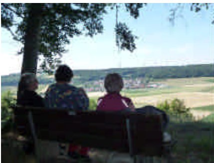
Blick vom Ohrberg auf Fleinheim

Fernab vom Straßenverkehr bot sich den Teilnehmern das Härtsfeld als Kulturlandschaft mit hohem Erholungswert. Seltene und geschützte Pflanzen neben dem Wanderweg, unerwartete Begegnungen mit sonst eher scheuen Waldtieren, einzigartige Ausblicke auf die Härtsfelddörfer und in die Nachbarlandschaften und die würzig frische Waldluft fügten die Wandertage zu einem eindrucksvollen Wandererlebnis.