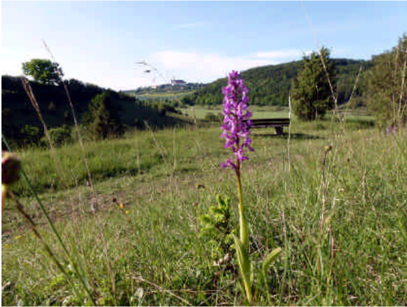
m Naturschutzgebiet Zwing mit Blick auf die Abtei Neresheim

Neresheim In der letzten Juniwoche, vom 23. Bis 27. Juni 2014, wurde die seit Januar von der Touristikgemeinschaft „Gastliches Härtsfeld“ und dem Landhotel Kanne ausgeschriebene Wanderwoche auf dem Härtsfeld durchgeführt. Fast ein Jahr lang wurden die gesamte Wanderstrecke von Alb-Guido Wekemann vorbereitet. Etwa fünf 22 Kilometer lange Wanderrouten wurden meist auf naturnahe Wanderpfade und, wenn möglich, auf die ausgeschilderten Wege des Schwäbischen Albvereins gelegt.